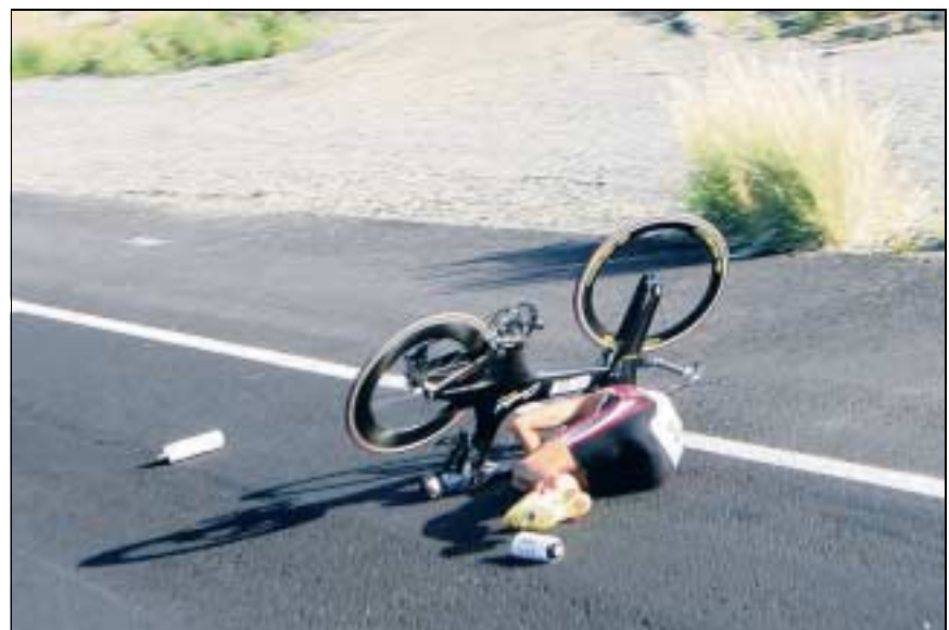
13. Oktober, Hawaii: Natascha Badmann stürzt und muss den Ironman aufgeben. (EQ)

ger, an meinen Schuss und wie Inler, Cesar und die anderen mich verfolgten, als ich zu den Fans rannte. Schon vor dem Spiel war klar, dass ich wieder nach Toulouse zurückgehe, weil mein Lohn zu hoch war für den FCZ. Im Nachhinein war das halbe Jahr in Zürich das Beste, was mir nach den vielen Verletzungen passieren konnte. Der Trainer Lucien Favre hat oft mit mir gesprochen und erklärt, was er von mir erwartet. Ein ungewöhnlicher Mann, ich habe viel von ihm gelernt.» (ram.)