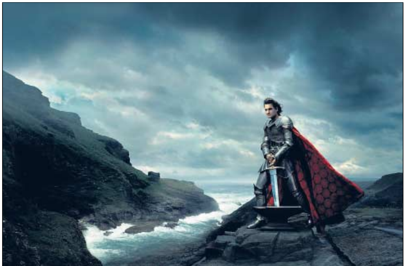
Ende Oktober: Die Fotografin Annie Leibovitz inszeniert den Tennisspieler Roger Federer als König Arthur.

Aber wenn ich dieses Bild sehe, wird mir auch bewusst, dass ich mich im Grenzbereich bewegte. Ich verlor rund zehn Prozent des Körpergewichts – für Untrainierte wäre das lebensgefährlich. Selbst von den Profis sind in Osaka einige wegen der Hitze und der Luftfeuchtigkeit kollabiert. Für mich war es ein Rennen der Extreme: Nie habe ich so gelitten, und nie habe ich am Ende eines Marathons so tiefes Glück empfunden.» (reg.)