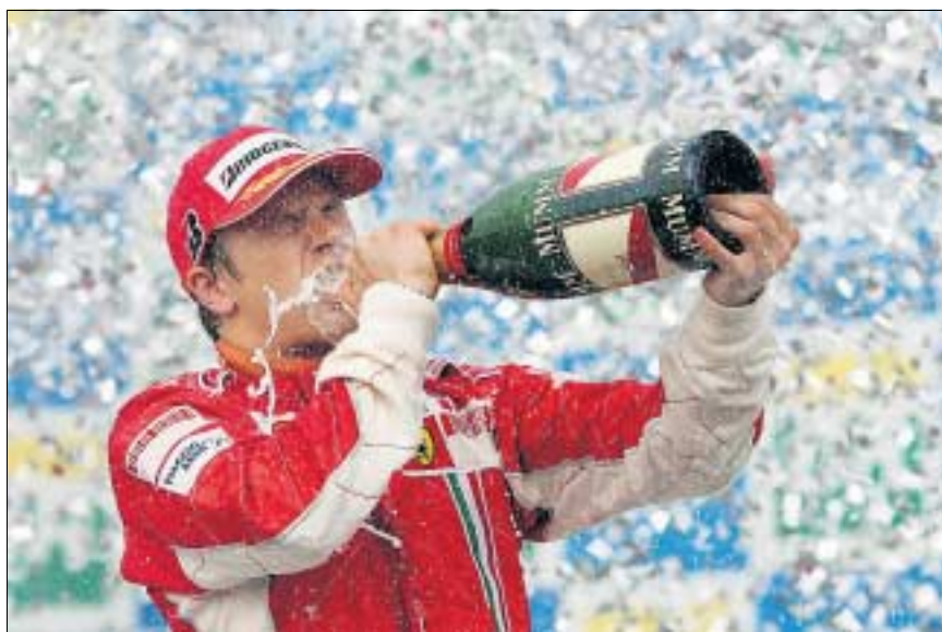
21. Oktober, São Paulo: Kimi Räikkönen wird überraschend F1-Weltmeister.

Momenten – so glaube ich wenigstens – kein Wort. Ich habe nur schwache Erinnerungen daran. Es muss zwei, drei Minuten nach der Schluss sirene sein. Die anderen feiern ganz in der Nähe, wir sitzen entmutigt, ausgepumpt und frustriert da. Es ist ein Gefühl, als komme gleich die ganze Welt auf dich herunter.» (bir.)