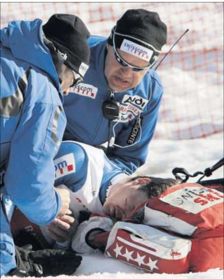
14. März, Lenzerheide: Bruno Kernen stürzt in der Abfahrt schwer.

Kernen stürzt in der Abfahrt von Lenzerheide schwer. Vier Monate später muss der fünffache WM- und Olympiamedaillengewinner wegen der Verletzungsfolgen die Karriere beenden.